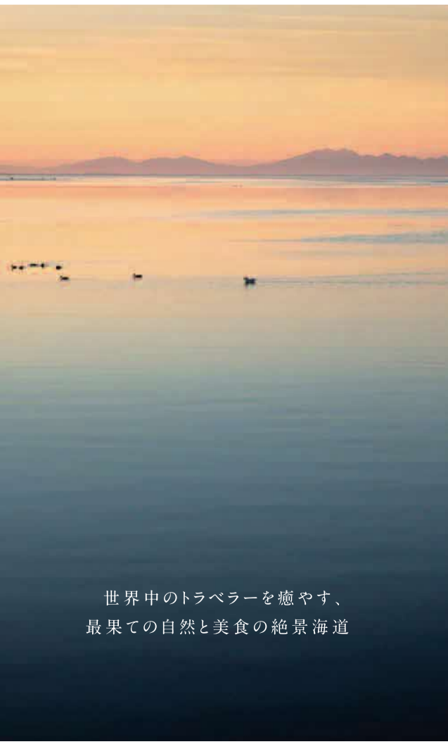
世界中のトラベラーを癒やす、最果ての自然と美食の絶景海道