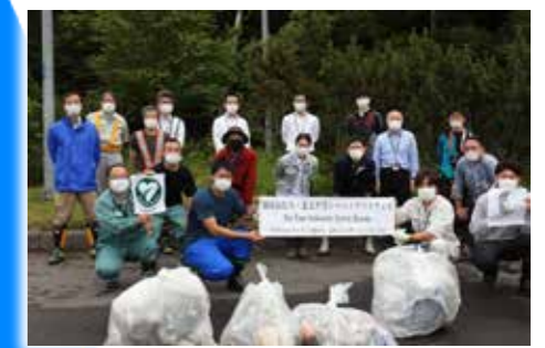
昨年行われた別保原野 パーキングエリア清掃・整備活動

知床ねむろ北太平洋シーニックバイウェイルート運営者代表会議 https://fareasthokkaidoscenicbyway.jimdofree.com/